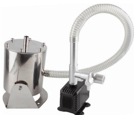
Фонтанная установка в сборе

Фонтанная установка с декоративной подсветкой FPL103 используют для создания водных уличных композиций - светящихся водяных арок.